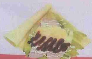
ハムピザ ham pizza ¥470