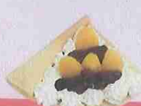
マロンあずき生クリーム marron azuki fresh cream ¥470