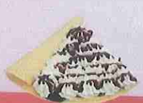
ブルーベリー生クリーム blueberry fresh cream ¥400