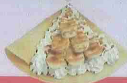
キャラメルバナナ生クリーム caramel banana fresh cream ¥450