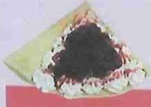
あずきいちご生クリーム azuki strawberry fresh cream ¥450