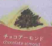
チョコアーモンド chocolate almond ¥320