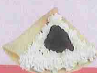
あずき生クリーム azuki fresh cream ¥420