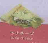
ツナチーズ tuna cheese ¥450