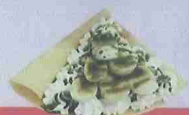
抹茶バナナ生クリーム matcha banana fresh cream ¥450