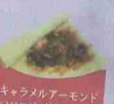
キャラメルアーモンド caramel almond ¥320

アレルギー：原材料の一部に乳・卵・小麦・大豆を含みます。 ※当店メニューの生クリームは冷凍ホイップを使用しております。