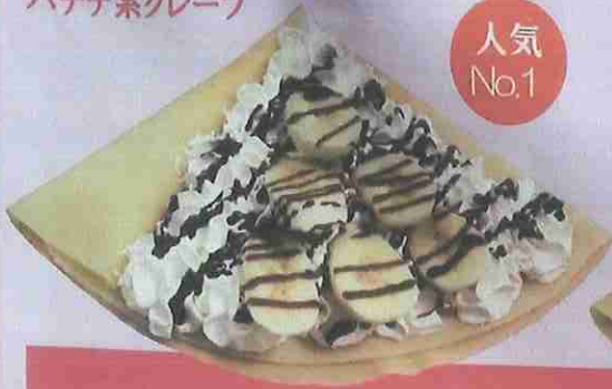
チョコバナナ生クリーム chocolate banana fresh cream ¥450