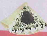
抹茶あずき生クリーム matcha azuki fresh cream ¥450