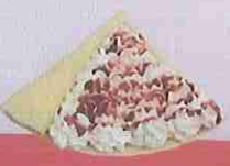
ストロベリー生クリーム strawberry fresh cream ¥400