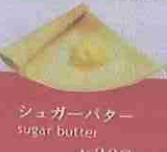
シュガーバター sugar butter ¥320