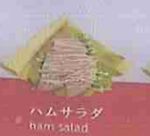
ハムサラダ ham salad ¥420