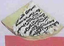
チョコ生クリーム chocolate fresh cream ¥400