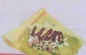
ツナピザ tuna pizza ¥470