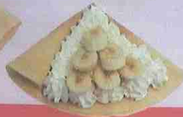
バナナ生クリーム banana fresh cream ¥420