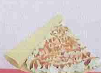
キャラメル生クリーム caramel fresh cream ¥400