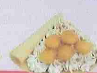
マロン生クリーム marron fresh cream ¥420