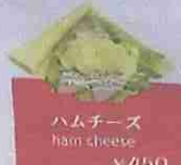
ハムチーズ ham cheese ¥450