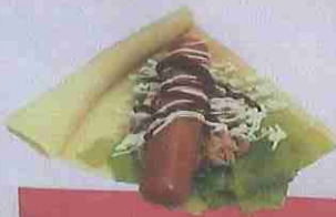
ソーセージツナ sausage tuna ¥470