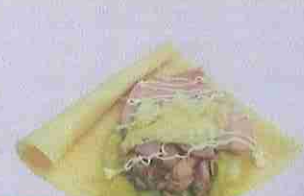
ハムツナチーズ ham tuna cheese ¥470