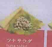
ツナサラダ tuna salad ¥420