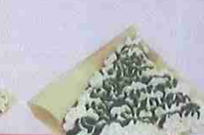
抹茶生クリーム matcha fresh cream ¥400